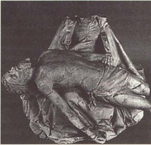
Figura 3. Pietà

Eis por que haverá sempre alguma sensação de incerteza quando uma imagem cristã for destruída ou mutilada (ver figura 3). Essa Pietà foi certamente quebrada por algum fanático, não sabemos se durante a Reforma ou durante a Revolução — não faltaram desses episódios na França. Mas quem quer que tenha sido, certamente nunca percebeu quanta ironia podia haver em acrescentar uma destruição exterior à destruição interior que a estátua em si tão bem representou: o que é uma Pietà , senão a imagem da Virgem com o coração partido, amparando em seu regaço o cadáver partido de seu filho, que é a imagem partida de Deus seu pai — embora, como a Escritura cuida de dizer, "nenhum de seus ossos tenha sido quebrado"? Como se pode destruir uma imagem já a tal ponto destruída? Como é possível querer erradicar a crença numa imagem que já desapontou todas as crenças, a ponto de Deus em pessoa, o Deus do superior e do transcendente, jazer aqui, morto, no colo da mãe? Quem poderá ir mais fundo, na crítica de todas as imagens, do que já está explicitamente afirmado pela teologia? Não seria antes o caso de argumentar que o iconoclasta exterior não faz mais que acrescentar um ato ingênuo e superficial de destruição a um ato de destruição extraordinariamente profundo? Quem é mais ingênuo: aquele que esculpiu a Pietà da 'kenósis' de Deus*, ou aquele que acredita haver crentes bastante ingênuos para atribuírem existência a uma mera imagem, em lugar de espon-