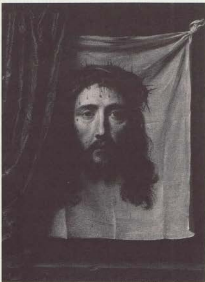
Figura 2: Philippe de Champaigne

Amantes, pintores religiosos e patronos da arte devem cuidar para que o modo usual da fala adquira determinada vibração, se querem estar seguros de que seus interlocutores não se deixarão distraidamente levar para longe, no espaço e no tempo. É exatamente isso que acontece subitamente ao pobre Gregório: durante a repetição do ritual, ele é repentinamente atingido pelo próprio ato de fala que transforma a hóstia no corpo de Cristo, pela percepção-realização das palavras sob a forma de um Cristo sofredor. O erro seria pensar que essa é uma imagem ingênua que apenas papistas retrógrados poderiam levar a sério: bem ao contrário, é uma sofisticadíssima versão do que é estar novamente côm-scio da real presença de Cristo na missa. Mas, para isso, a pessoa deve ouvir as duas injunções simultaneamente. Essa não é a pintura de um milagre, embora também o seja: antes, essa pintura também diz o que é compreender a palavra 'milagre' literalmente e não no sentido habitual, blasé , da palavra — e 'literal' aqui não significa o oposto de espiritual, mas de ordinário, alheado, indiferente.